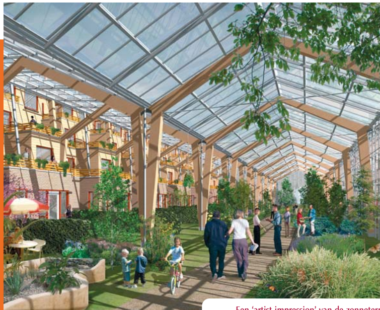
Een 'artist impression' van de zonneterp.

In het kielzog van de experimentele Energieproducerende Kas zijn verschillende bedrijven bezig met de ontwikkeling van de Zonneterp, een combinatie van tuinbouwkassen en woningen. Hierbij gaat het niet alleen om het benutten van overtollige zonnewarmte, maar ook om de productie van drinkwater en het benutten van groente-, fruit- en tuinafval en ontlasting voor de productie van biogas en CO 2 . In verschillende plaatsen, waaronder het al genoemde Huissen, Dantumadeel (bij Dokkum) en in het Westland worden haalbaarheidsstudies gedaan naar de Zonneterp. Optimisten verwachten dat in 2007 de eerste huizen warmte en mogelijk ook drinkwater uit de kas zullen krijgen. In principe kunnen er één miljoen woningen worden aangesloten op tuinbouwkassen. Dat zou een besparing van 20 tot 30 procent op het totale aardgasverbruik opleveren. Zie voor meer informatie www.zonneterp.nl